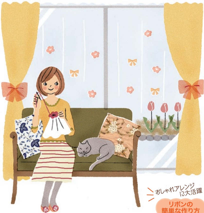
おしゃれアレンジに大活躍 リボンの簡単な作り方